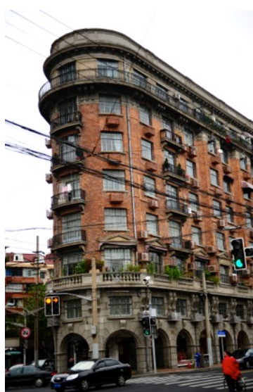
Normandia bérház (AAA)