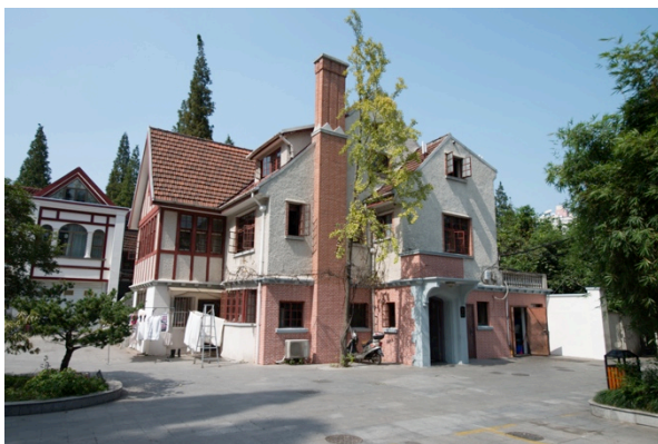
Felújítási munkálatok a Columbia Circle-ben