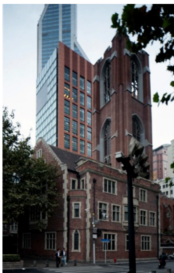
Moore Memorial templom