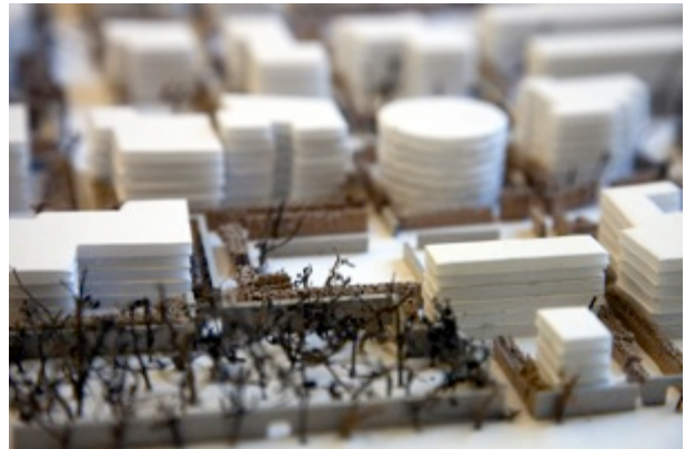
MOME diákok prezentációja a Columbia Circle fejlesztési ötleteiről