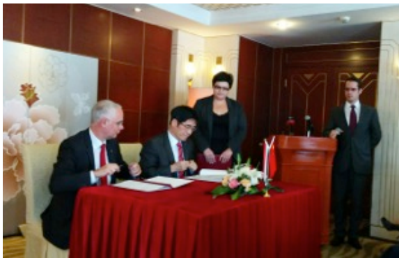
A Hudec Ösztöndíj dokumentumának aláírása a Park Hotelben

Az Alapítvány számára is fontos esemény volt Balog Zoltán Miniszter Úr által képviselt Hudec Ösztöndíj kapcsolatos szerződés aláírása. Az ösztöndíj program célja, hogy a magyar-kínai oktatási és kulturális kapcsolatokba új területeket bevonjon: az építészetet, a vizuális művészeteket és a designt valamint ezek sikeres magyarországi képzését tegye elérhetővé sanghaji egyetemi hallgatók számára. Az ösztöndíj páratlan módon állít emléket Hudec László munkásságának és eredményeinek, aki a Magyar Kir. József Műegyetem (mai Budapesti Műszaki Egyetem) professzorainak köszönheti azt a szakmai tudást, amivel 1918-ban sanghaji karrierje elindult és ma is hatvannál több épületében tetten érhető. A 65 éves kínai-magyar diplomáciai évforduló aktualitása szerint évi 65 kíniai diák oktatását és magyarországi tartózkodását teszi lehetővé a „ Hudec Ösztöndíj ” program, melyet Hudec legismertebb épületében, a Park Hotelben írtak alá a kínai partnerek. A Hudec Kulturális Alapítvány honlapján egy angolnyelvű, információs web platform is elindult, hogy segítse a programra jelentkezők tájékoztatását, a partnerek közti kommunikációt: http://architecture.hudecproject.com .