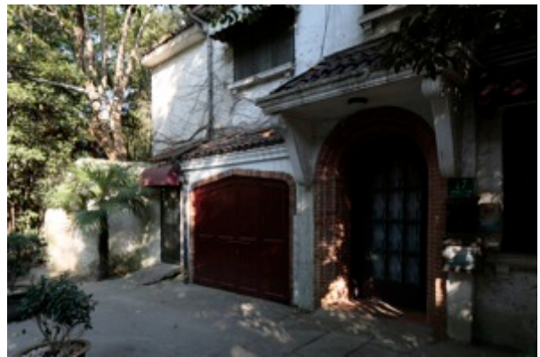
Hudec tervezte, spanyol stílusú villa