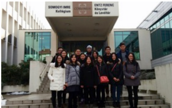
Az ECNU Design School diákjai a Corvinus Egyetemen

A 2014 novemberében meghírdetett Hudec Ösztöndíj program első jelentkezői megérkeztek a budapesti Corvinus Egyetem Tájépítész Karára . A képzésre sikeresen pályázó 11 kínai hallgató a sanghaji East China Normal University, Design Schoolból érkezett. Az ösztöndíjasok az egyetem angolnyelvű szakmai kurzusain, és specializált előadásain vesznek részt.