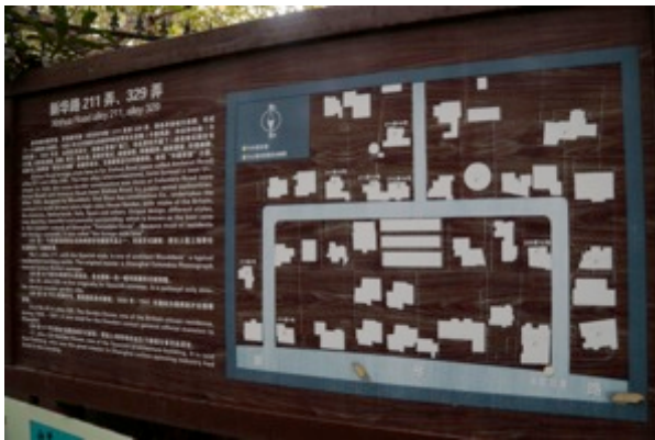
A Columbia Circle beépítettsége ma

A Hudec Kulturális Alapítvány kezdeményezésére megszervezett egyetemi kurzusprogram 2014 novemberében zajlott két helyszínen is. A Budapesti Műszaki és Gazdaságtudományi Egyetem, Építészettörténeti és Műemlékvédelmi Karán és a Moholy-Nagy Művészeti Egyetem, Építészeti Intézetében meghírdetett egy hetes intenzív kurzusprogramon 23 diák vett részt. A program keretében a diákok feladata a következő volt: az egyik kevésbé ismert Hudec László tervezte villanegyed környezetéhez kapcsolódóan fejlesztési tervek, koncepciókat készíteni, a közterület használatára, parkosítására, illetve stílusban tervezni közösségi épületet az ott élők számára. A HUDEC ZONE workshop publikus facebook odala: www.facebook.com/groups/hudeczone/