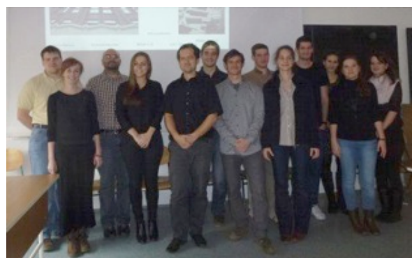
BME diákok prezentációja a Columbia Circle fejlesztési ötleteiről